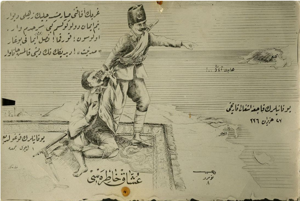
EK-8: İtiklal Hatbi Kartpostalları-Uşak Hatırası