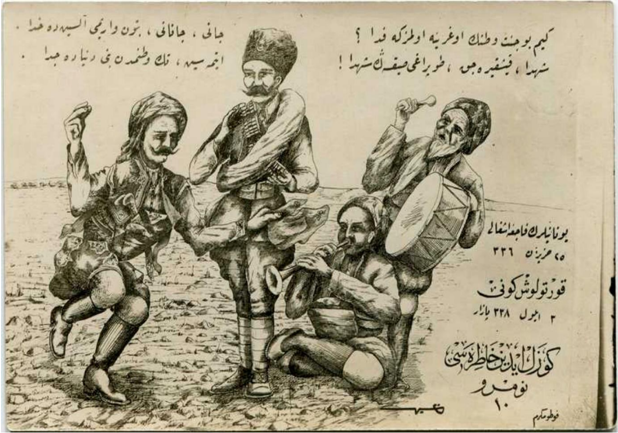
EK-7: İstiklal Harbi Kartpostalları-Aydın Hatırası